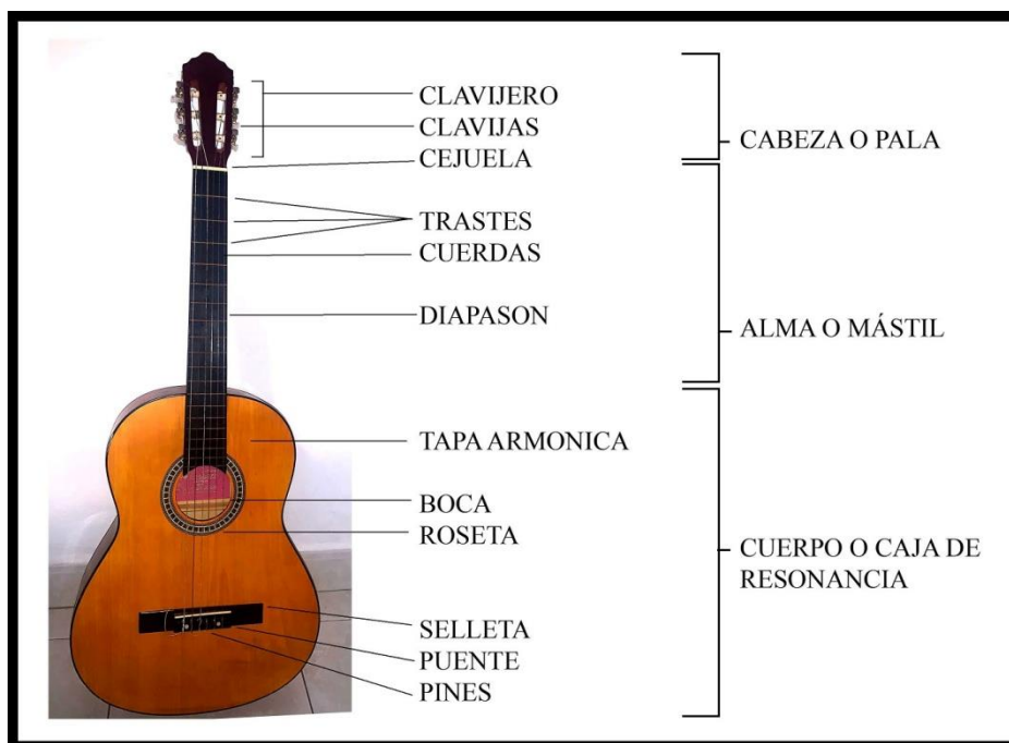
Fig. 5.- Partes de una guitarra.

Dentro de la primera división tripartita vinculada con el número 3 (cabeza, alma y cuerpo), describiremos los componentes de cada uno 20 .