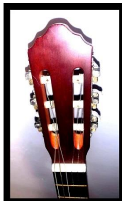
Fig. 4.- Detalle del clavijero de la guitarra. Fotografía propia del autor.

Profundizando en estas partes vemos que la caja de resonancia contiene una serie de elementos tales como la tapa armónica, boca, roseta, golpeador, selleta o el puente entre otros como veremos a continuación. Así mismo, el mástil se divide en cejuela, trastes y diapasones, mientras que la cabeza se compone de clavijero y clavijas (Véase Figura 5). En las siguientes líneas veremos de forma más detenida estos elementos y su vinculación numerológica que se ha transmitido a través de los siglos.