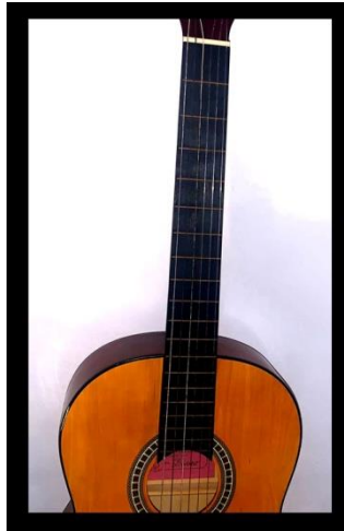
Fig. 3.- Detalle de la caja de resonancia y mástil de la guitarra.