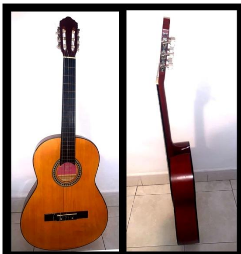
Fig. 2.- Frontal y perfil de una guitarra española.

vemos una primera división tripartita vinculada con el número 3, la cual se distribuye de la siguiente manera 19 : la caja de resonancia o cuerpo en relación con el número 8; el mástil o alma en vinculación con el número 1 (Véase Figura 3); y la pala o cabeza donde se ajusta la tensión de las cuerdas (Véase Figura 4). Todo ello mantiene una curiosa relación con el cuerpo y la concepción del alma, que se transmite entre los luthieres sin entender su significado original de los mismos y por lo que fueron concebidos en un primer momento.